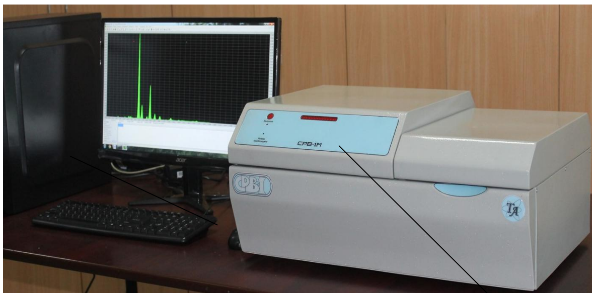
Рисунок 1 – Общий вид спектрометра CPB-1M