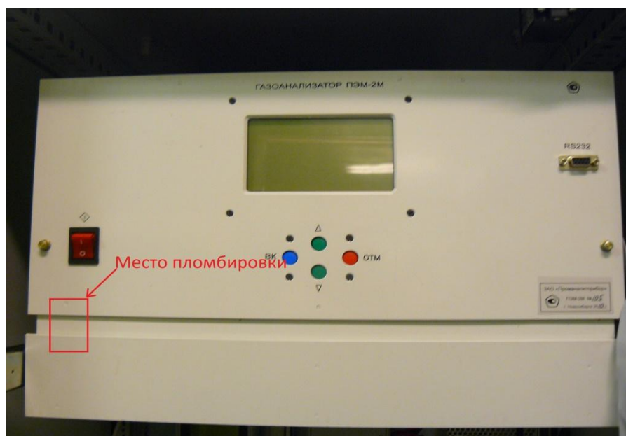
Рисунок 2 - Место пломбировки комплекса