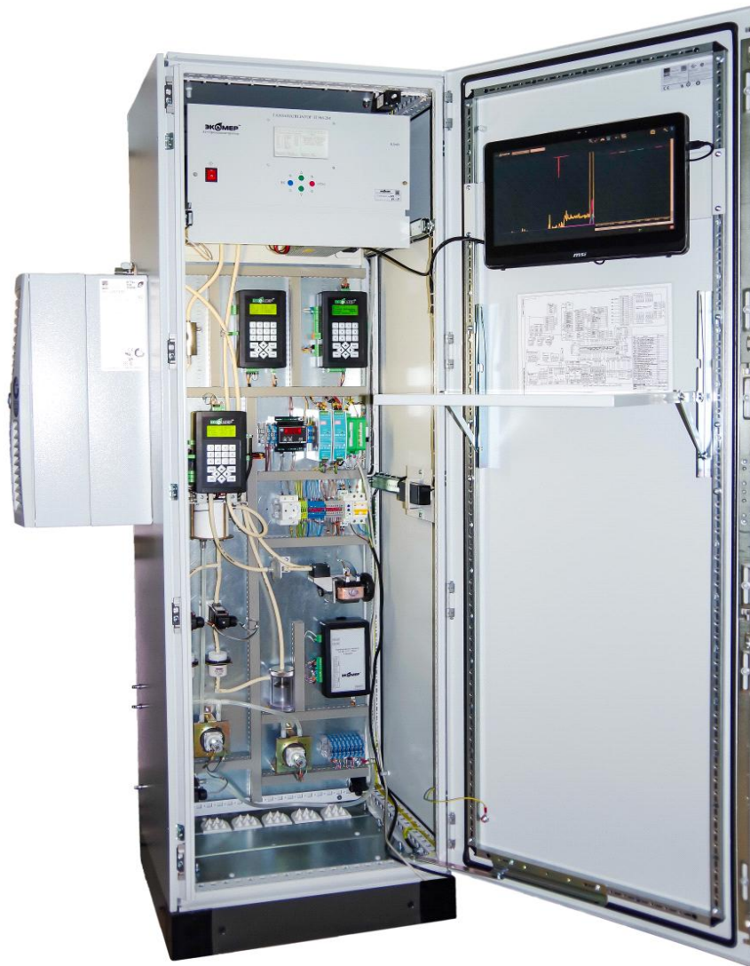
Рисунок 1 - Общий вид комплекса газоаналитического ПЭМ-2М.1 (модуль основной МО)