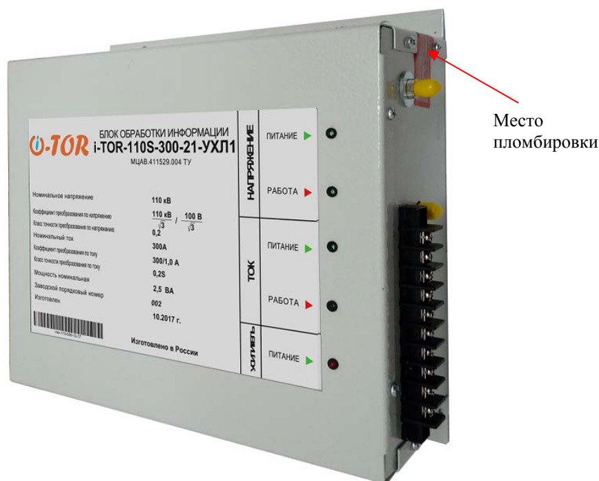
Блок обработки информации Рисунок 1 - Общий вид средства измерений и обозначение мест пломбировки от несанкционированного доступа