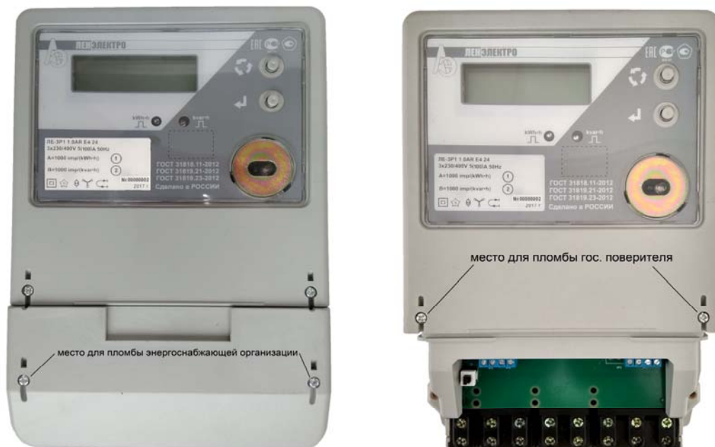
Рисунок 1 - Общий вид счетчика LE-3P и места пломбировки

Схема пломбировки счетчиков от несанкционированного доступа энергоснабжающей организацией и после поверки осуществляется в виде навесных пломб с оттиском клейма поверителя на пломбировочных винтах, как показано на рисунках 1-3.