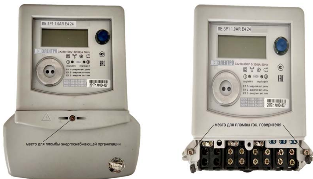
Рисунок 2 - Общий вид счетчика LE-3P1 и места пломбировки