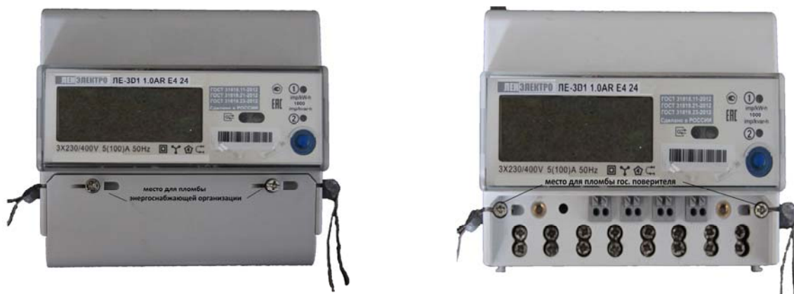
Рисунок 3 - Общий вид счетчика ЛЕ-3Д и места пломбировки