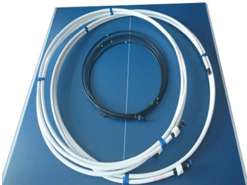
Рисунок 1 - Внешний вид многозонной погружной термогирлянды