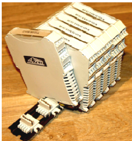
Рисунок 4 - Внешний вид электронных модулей WAD-TC-BUS и WAD-LAN/RS232/USB/RS485-BUS