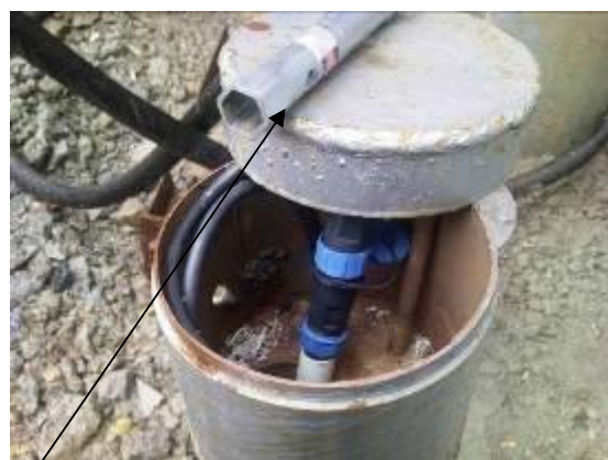
Рисунок 5 - Место пломбировки от несанкционированного доступа крышки скважины и внешний вид термогирлянды, установленной в скважине, с подключением к общей шине

Место пломбировки от несанкционированного доступа