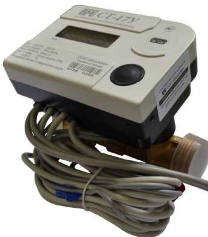
Рисунок 1 - Общий вид теплосчётчиков