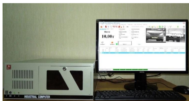
Рисунок 2 – Общий вид электронных весоизмерительных устройств

Знак поверки в виде клейма наносится в таблицу 11 раздела паспорта «Данные о поверке весов», заверенной поверителем, а также на свидетельство о поверке (в случае его оформления).