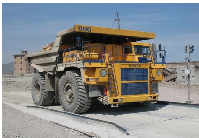
Рисунок 1 – Общий вид ГПУ

Общий вид ГПУ представлен на рисунке 1, электронное весоизмерительное устройство – на рисунке 2.