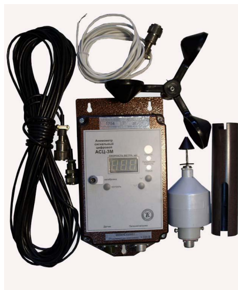
Рисунок 2 - Общий вид анемометров сигнальных цифровых АСЦ-3ПМ

Место пломбирования анемометров сигнальных цифровых АСЦ-3П показано на рисунке 3.