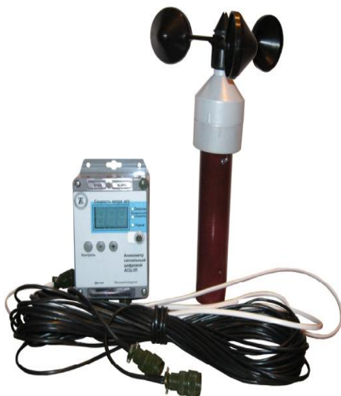
Рисунок 1 - Общий вид анемометров сигнальных цифровых АСЦ-3ПП

Общий вид анемометров сигнальных цифровых АСЦ-3П показан на рисунках 1 и 2.