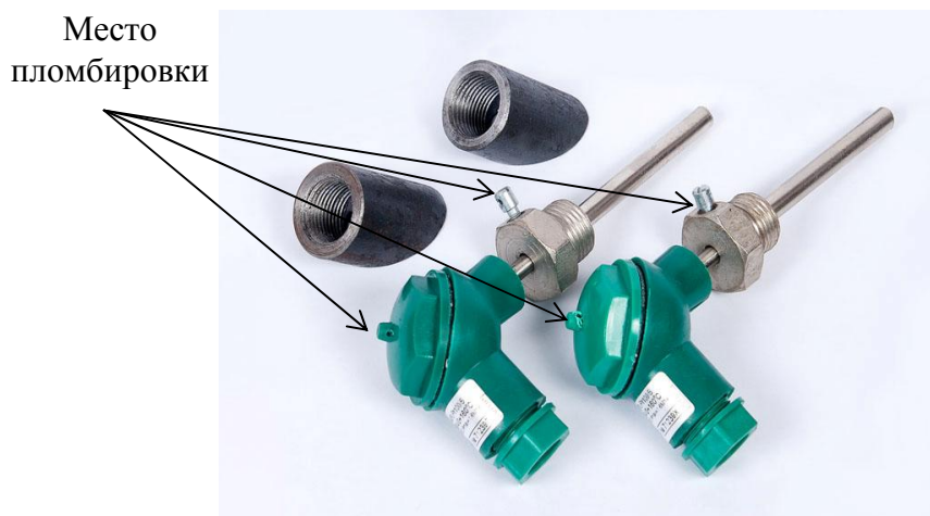
Рисунок 1 - Внешний вид комплекта термопреобразователей сопротивления ТСПА-К (исполнение PL)

Внешний вид комплектов термопреобразователей сопротивления ТСПА-К с указанием места пломбировки приведен на рисунках 1 и 2.