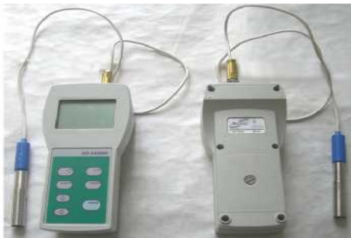
Рисунок 1 - Внешний вид кондуктометров портативных КП-150МИ

Схема пломбировки для защиты от несанкционированного доступа и обозначение мест для нанесения знаков поверки приведена на рисунке 2.