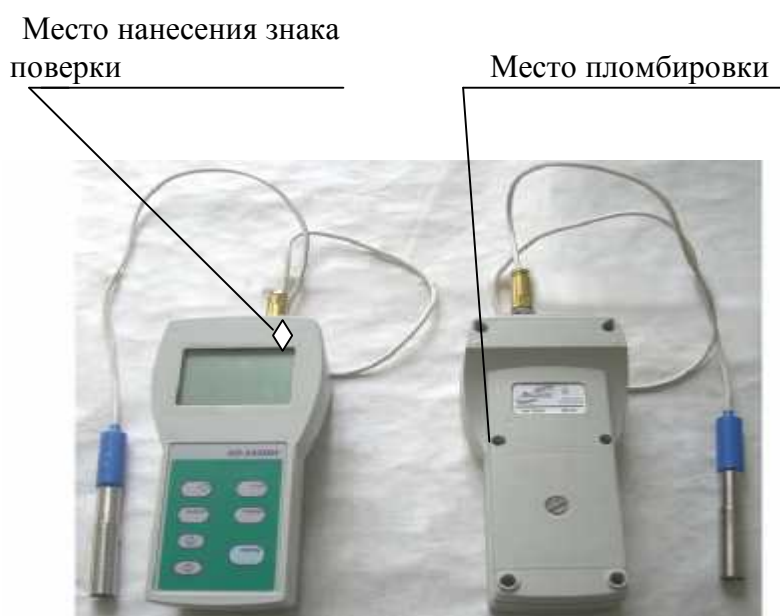
Рисунок 2 - Схема пломбировки для защиты от несанкционированного доступа, обозначения места нанесения знака поверки

Схема пломбировки для защиты от несанкционированного доступа и обозначение мест для нанесения знаков поверки приведена на рисунке 2.