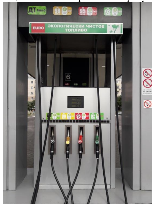
заводские номера 016, 017