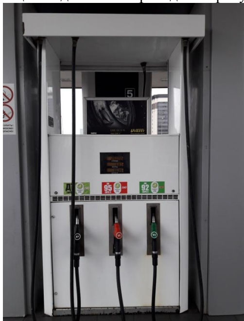
заводские номера 045, 047, 042

Общий вид колонки приведен на рисунке 1, места пломбирования на рисунках 2 – 3.