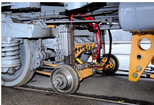
Рисунок 1 – Общий вид автоматизированных систем контроля и оценки геометрических параметров пути «СОКОЛ»

Схема расположения системы приведена на рисунке 2.