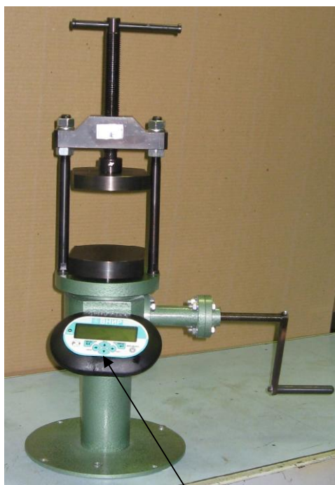
Место нанесения знака поверки

Пять модификаций прессов отличаются диапазонами измерений, ценой единицы наименьшего разряда отсчётного устройства, габаритными размерами и массой.