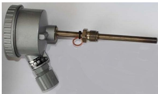
б) преобразователь температуры