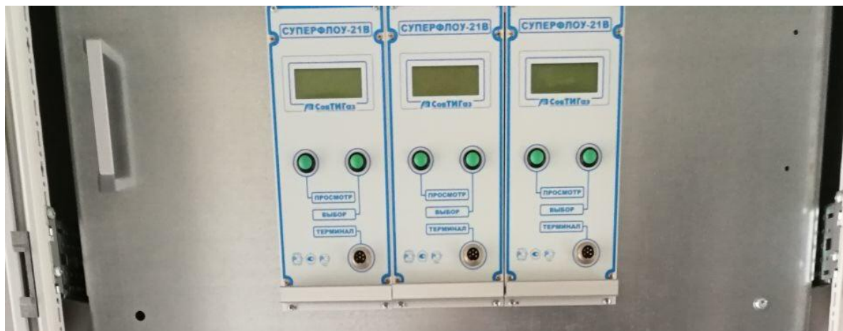
а) вычислители, установленные в шкафе

Общий вид средства измерений представлен на рисунке 1.