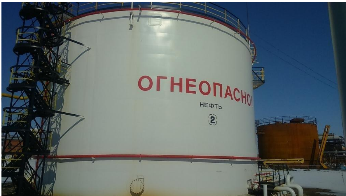
Рисунок 1 - Общий вид резервуара стального вертикального цилиндрического РВС-3000