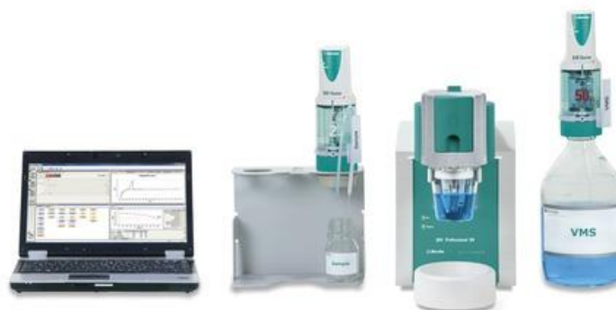
Рисунок 3 - Полуавтоматический комплекс на базе 894 Professional CVS для анализа органических добавок в гальванических ваннах