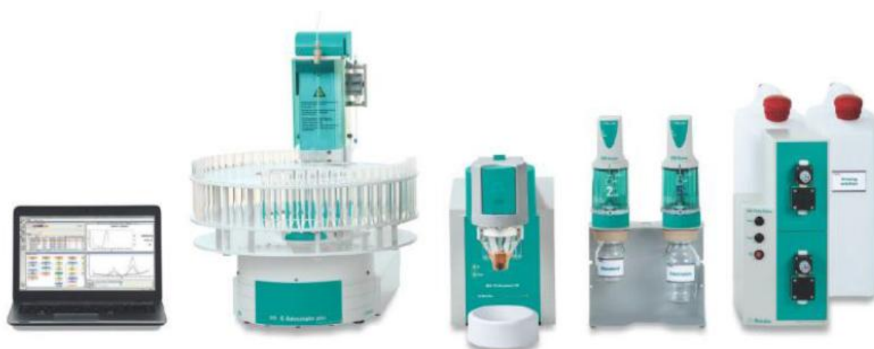
Рисунок 3 - Автоматизированный комплекс на базе 884 Professional VA/CVS с мультирежимным электродом ММЕ