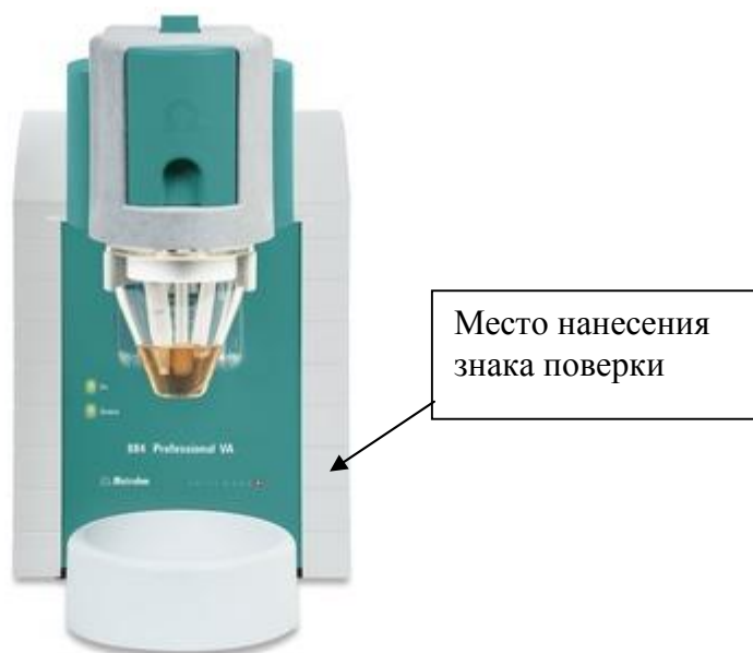
Рисунок 1 - Общий вид анализатора вольтамперометрического 884 Professional VA/CVS

Пломбирование анализаторов вольтамперометрических модели 884 Professional VA/CVS, 894 Professional CVS отсутствует.