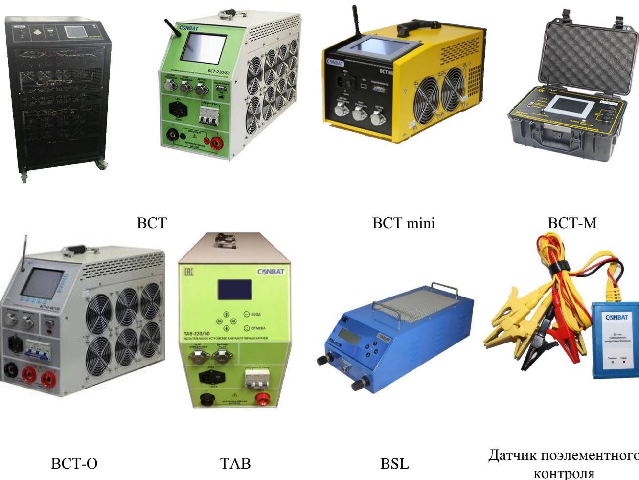
Рисунок 1 - Общий вид устройств разрядно-диагностических аккумуляторных батарей CONBAT