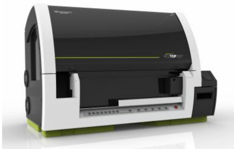
Рисунок 2 - Общий вид анализатора коагулометрического автоматического ACL TOP модификации ACL TOP 550 CTS