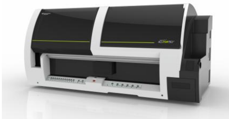
Рисунок 3 - Общий вид анализатора коагулометрического автоматического ACL TOP модификаций ACL TOP 750 CTS и ACL TOP 750