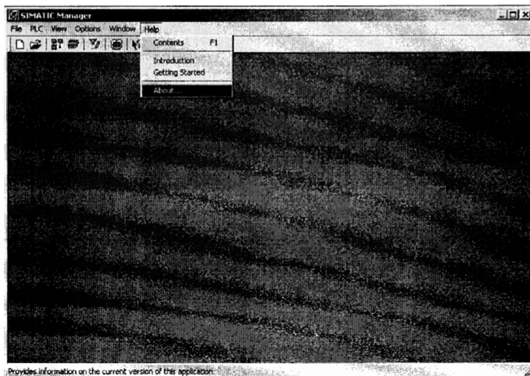
Рисунок 1 – Окно SIMATIC Manager

1) Запустить на АРМ компонент SIMATIC Manager. В верхней панели меню выбрать пункт Help → About (рисунок 1).