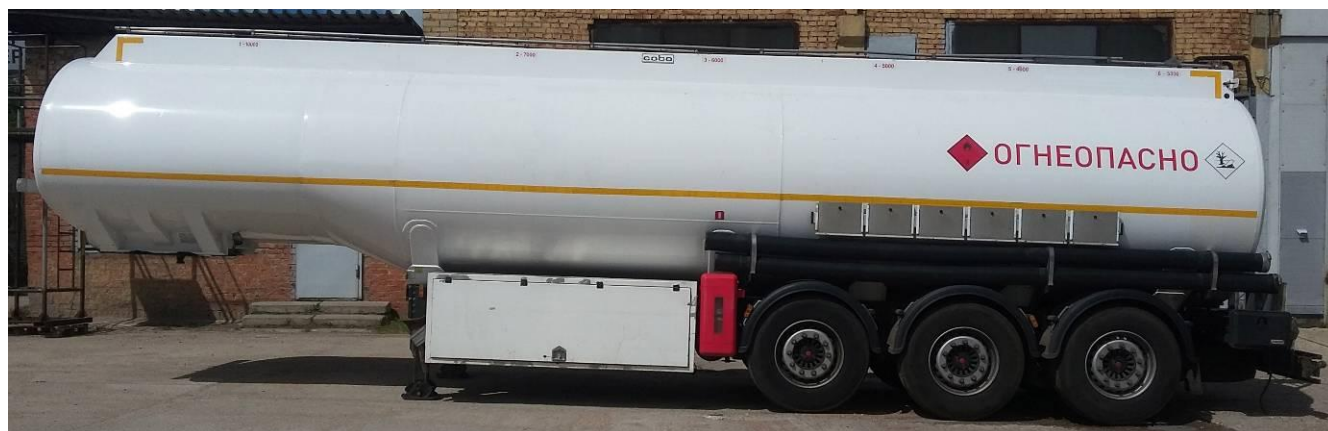
Рисунок 1 - Общий вид полуприцепа-цистерны СОВО-ППЦ-38