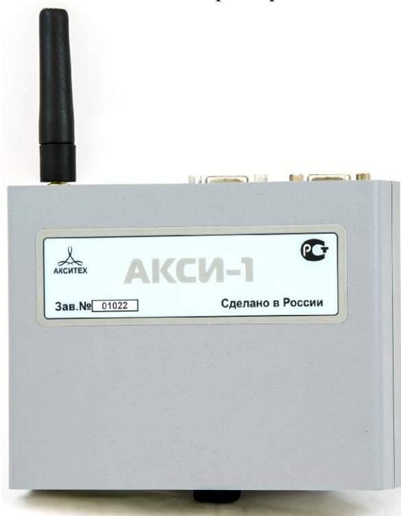
Рисунок 2 - Внешний вид контроллеров АКСИ

Пломбирование контроллеров не предусмотрено.