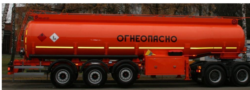
Рисунок 2 - Общий вид полуприцепа-цистерны БЕЦЕМА-ППЦ-25