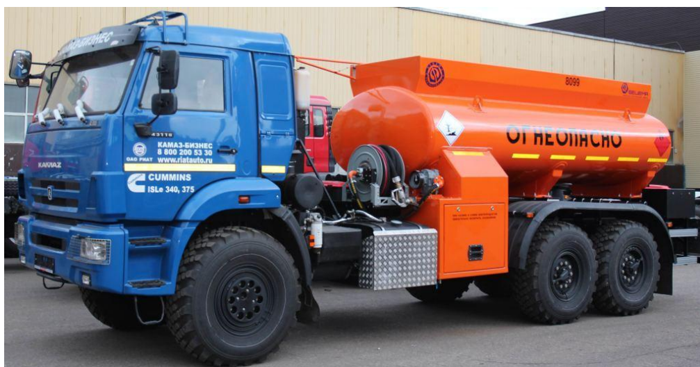
Рисунок 1 - Общий вид автотопливозаправщика БЕЦЕМА-АТЗ-08

Общие виды АЦ, АТЗ, ППЦ, ППТЗ, ПЦ, ПТЗ представлены на рисунках 1, 2 и 3.