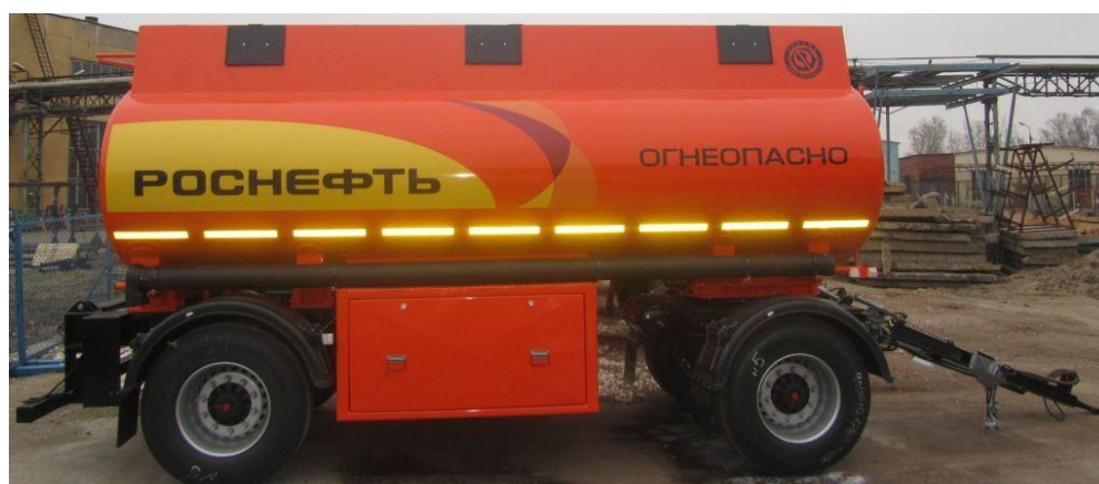
Рисунок 3 - Общий вид прицепа-цистерны БЕЦЕМА-ПЦ-15