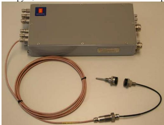
Рисунок 1 – Общий вид устройств с одним ИК

Оборудование входящие в состав устройств имеет исполнения со взрывозащищенной конструкцией выполненной в соответствии с требованиями ТР ТС 012/2011.