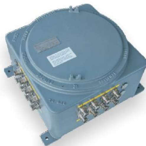
Рисунок 5 – общий вид БОС (исполнение 2)