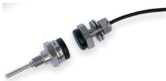
Рисунок 2 – датчик температуры и стационарная антенна