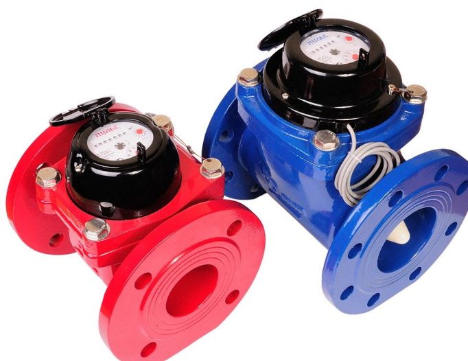
Рисунок 2 – Общий вид счётчиков с Ду 50 - 100 мм