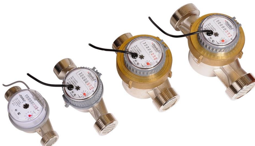
Рисунок 1 – Общий вид счётчиков с Ду 15 - 40 мм