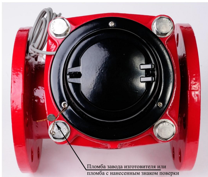
Пломба завода изготовителя или пломба с нанесенным знаком поверки