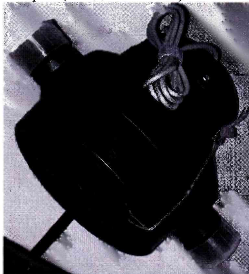
Рисунок 2 – Место нанесения знака поверки.

Место нанесения знака поверки (в виде наклейки) показано на рис.2.