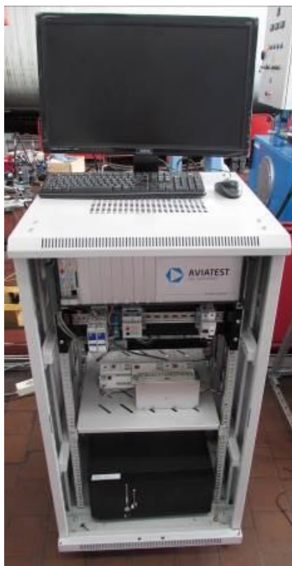
Рисунок 1 – Общий вид рабочего места оператора СИС

Общий вид устройств, входящих в состав СИС приведен на рисунке 2.