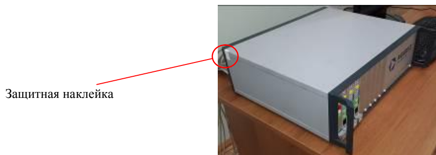
Рисунок 3 – Схема нанесения защитной наклейки от несанкционированного доступа

Схема нанесения защитной наклейки от несанкционированного доступа на боковую панель СУ «АВИАТЕСТ» представлена на рисунке 3.