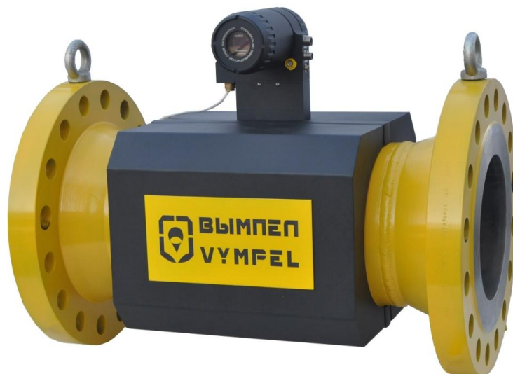
Рисунок 1 - КИУ «Вымпел-500» исполнение «01»