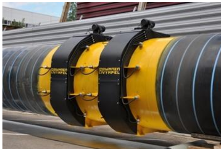
Рисунок 2 - КИУ «Вымпел-500» исполнение «02»