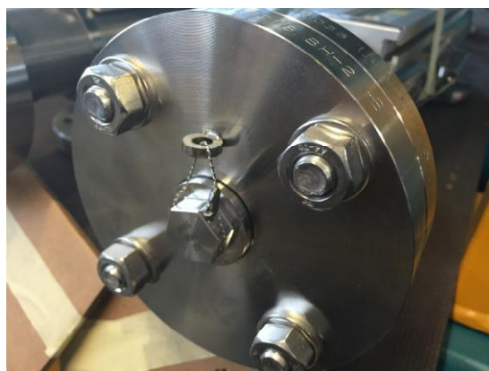
Рисунок 5 – Варианты пломбирования корпуса уровнемера BNA пломбой поверителя

Пломбирование корпуса датчиков может осуществляться нанесением на боковую поверхность корпуса датчика пломбы поверителя (в виде наклейки), которая разрушается при попытке удалить ее или вскрыть корпус (Рисунки 6 и 7).