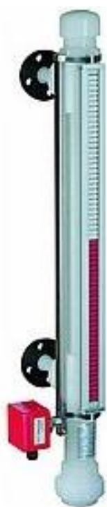
Рисунок 2 – Общий вид уровнемеров модели BNA (исполнение с герконовым датчиком; пластиковый корпус)