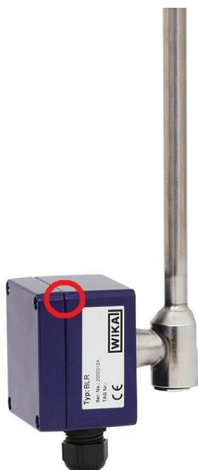
Рисунок 6 – Место нанесения на корпуса датчиков BLM пломбы поверителя