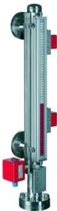
Рисунок 1 – Общий вид уровнемеров модели BNA (исполнение с герконовым датчиком и двумя магнитными переключателями; стальной корпус)

В целях контроля за уровнем (контроль переполнения, сигнализация и т.д.) уровнемер может дополнительно комплектоваться герконовым переключателем ВГУ. Переключатель монтируется на определенной высоте на байпасной камере ВЗГ при помощи хомута или на индикатор ВМД при помощи специальных крепежей. Когда поплавок в байпасной камере достигает уровня, отмеченного на корпусе переключателя, магнитное поле поплавка вызывает срабатывание переключателя.