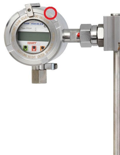
Рисунок 7 – Место нанесения на корпуса датчиков BLM пломбы поверителя