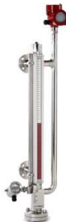
Рисунок 3 – Общий вид уровнемеров моделей BNA-SD (DUPlus), BNA-HD (DUPlus) (исполнение с магнитострикционным датчиком на первой байпасной камере и контактным микроволновым датчиком на второй байпасной камере)