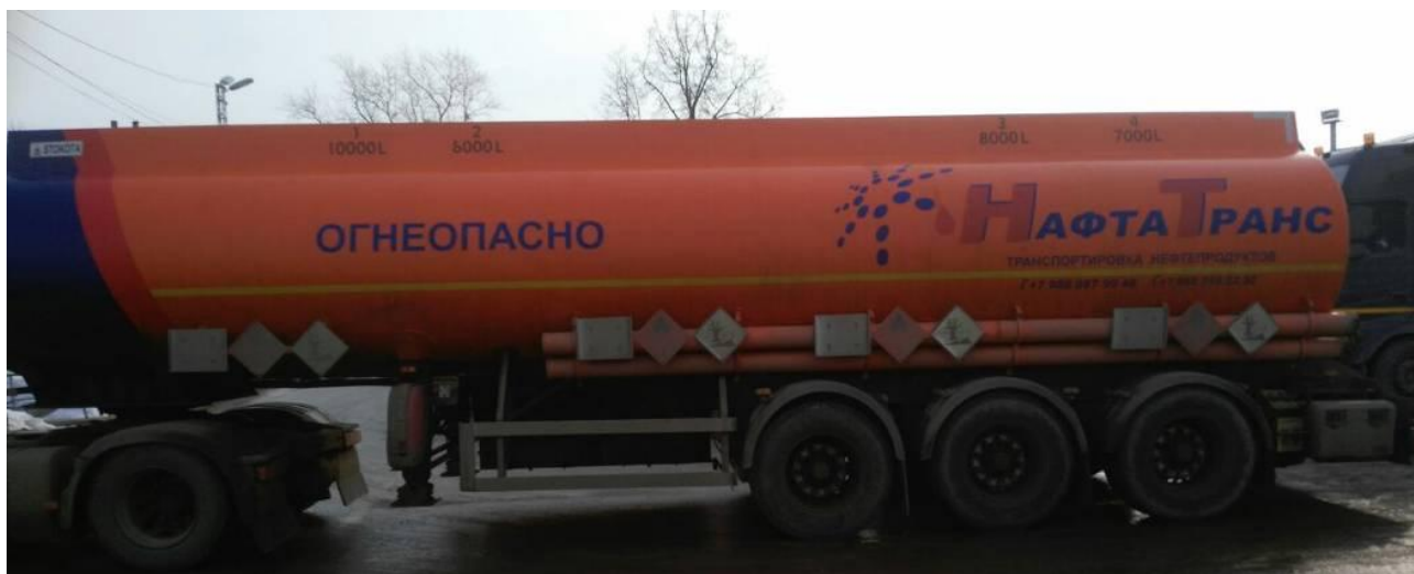
Рисунок 1 - Общий вид полуприцепа-цистерны STOKOTA OPL-38-3/FUE

Схема пломбировки для защиты от несанкционированного изменения положения указателя уровня налива, обозначение места нанесения знака поверки представлены на рисунке 2.