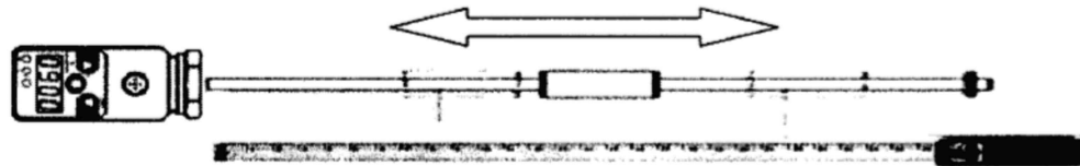
Рисунок 3 – Проверка уровнемера с помощью рулетки при демонтаже