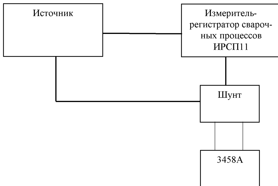
Рисунок 2 – Схема проверки допускаемой основной приведенной погрешности измерения силы постоянного тока

1) собрать схему, представленную на рисунке 2;