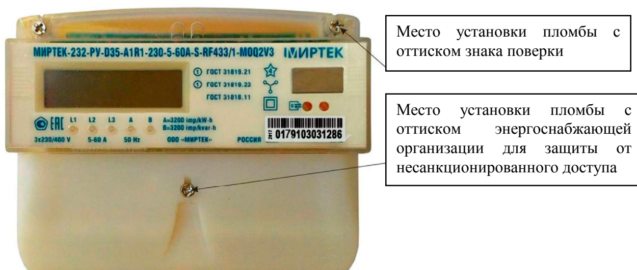
Рисунок 7 - Общий вид счетчика и схема пломбировки от несанкционированного доступа в корпусе типа D35