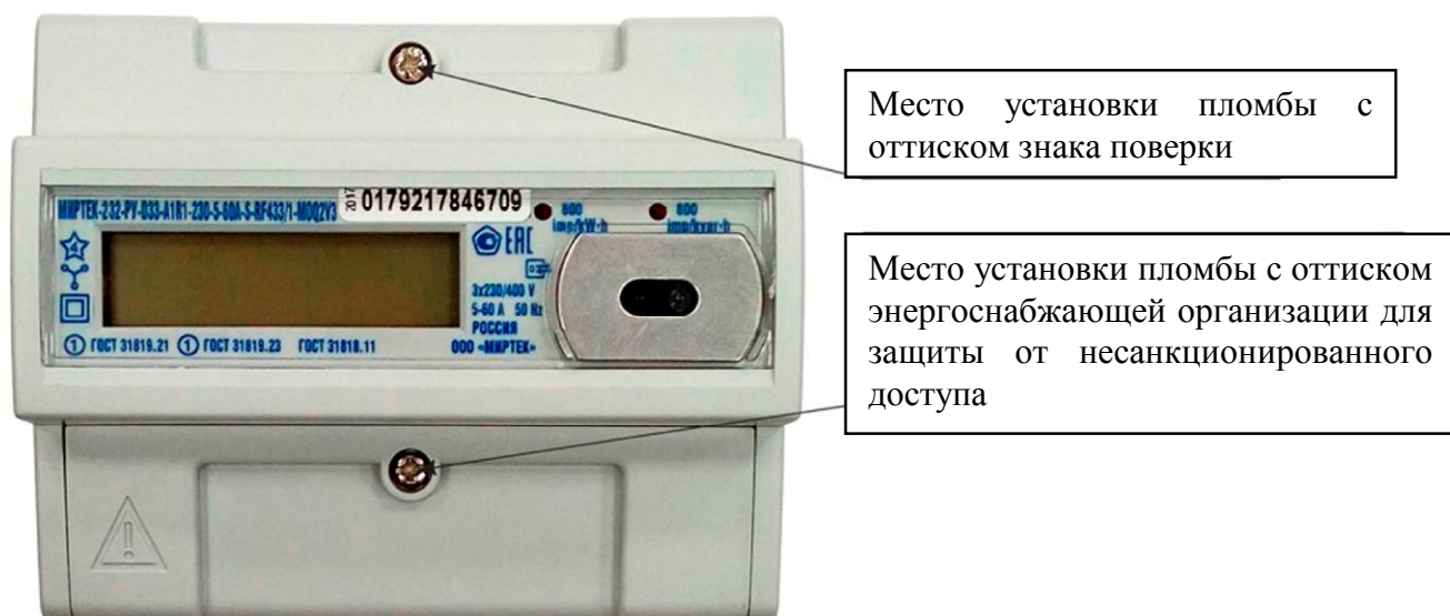
Рисунок 5 - Общий вид счетчика и схема пломбировки от несанкционированного доступа в корпусе типа D33