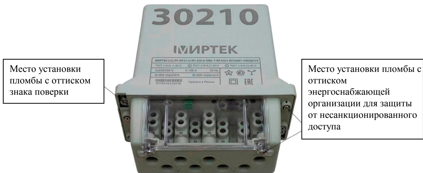
Рисунок 8 - Общий вид счетчика и схема пломбировки от несанкционированного доступа в корпусе типа SP31