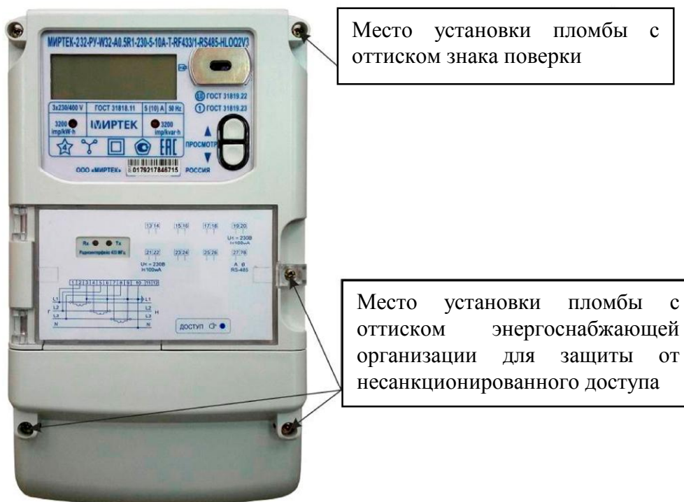
Рисунок 2 - Общий вид счетчика и схема пломбировки от несанкционированного доступа в корпусе типа W32