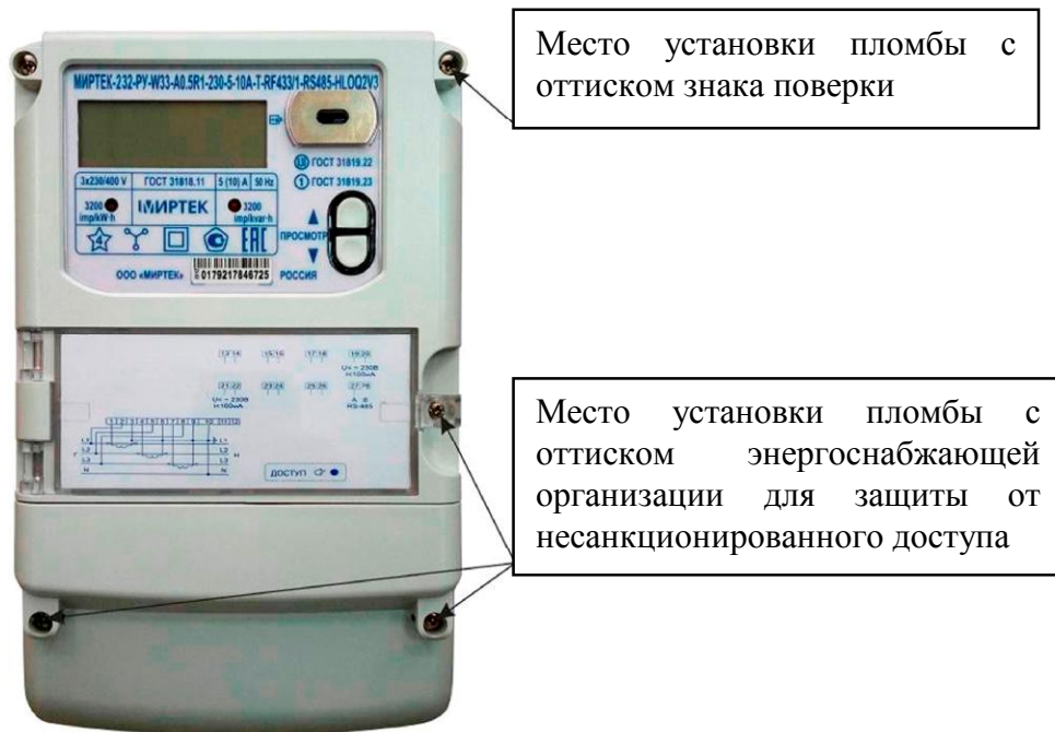
Рисунок 3 - Общий вид счетчика и схема пломбировки от несанкционированного доступа в корпусе типа W33