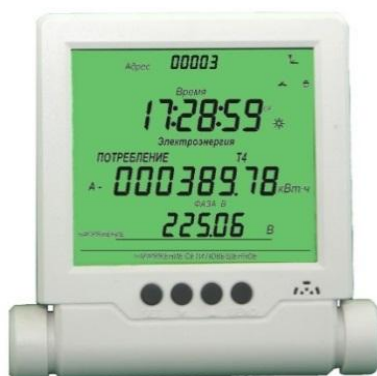
Рисунок 9 - Общий вид дистанционного индикаторного устройства