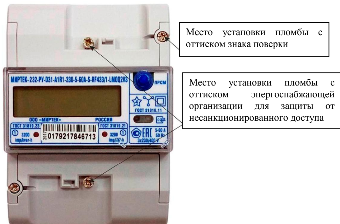
Рисунок 4 - Общий вид счетчика и схема пломбировки от несанкционированного доступа в корпусе типа D31