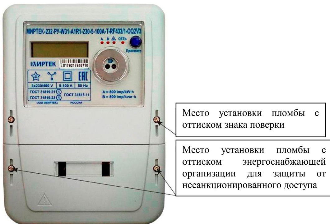
Рисунок 1 - Общий вид счетчика и схема пломбировки от несанкционированного доступа в корпусе типа W31