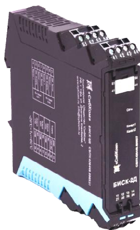
Рисунок 1 - Внешний вид средства измерений

Внешний вид преобразователя и места нанесения знака поверки представлены на рисунках 1 и 2.