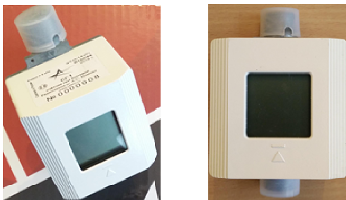
Рисунок 1 - Общий вид счетчиков газа СГ-1 вариант 12 серия 04

Счетчики имеют отсчетное устройство на жидкокристаллическом индикаторе.