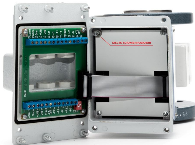
Рисунок 2 - Схема пломбировки от несанкционированного доступа и место нанесения знака поверки

Пломбировка расходомеров Метролог-Р осуществляется нанесением знака поверки давлением на специальную мастику, расположенную в чашечке винта внутри электронного блока, в соответствии с рисунком 2.