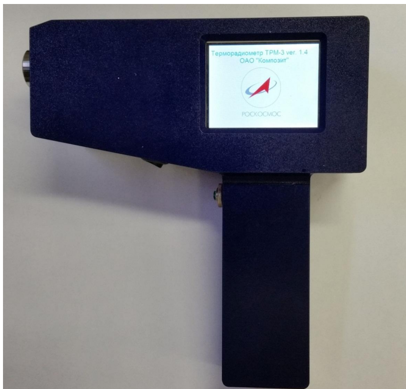
Рисунок 1 - Общий вид рефлектометра