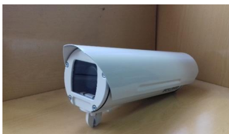
IP-видеокамеры тип С