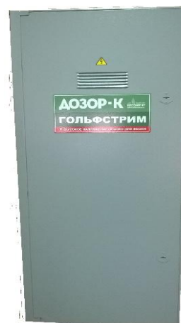
вариант исполнения блока управления Дозор-К «Гольфстрим»