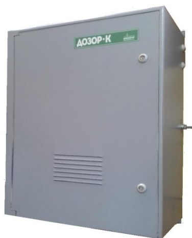
вариант исполнения блока управления Дозор-К «Рубеж»

Внешний вид составных частей комплексов с указанием мест пломбирования и нанесения знака утверждения типа приведен на рисунках 1, 2.