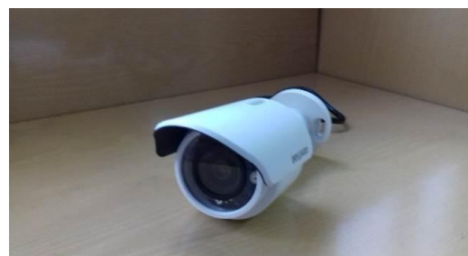
IP-видеокамеры тип О