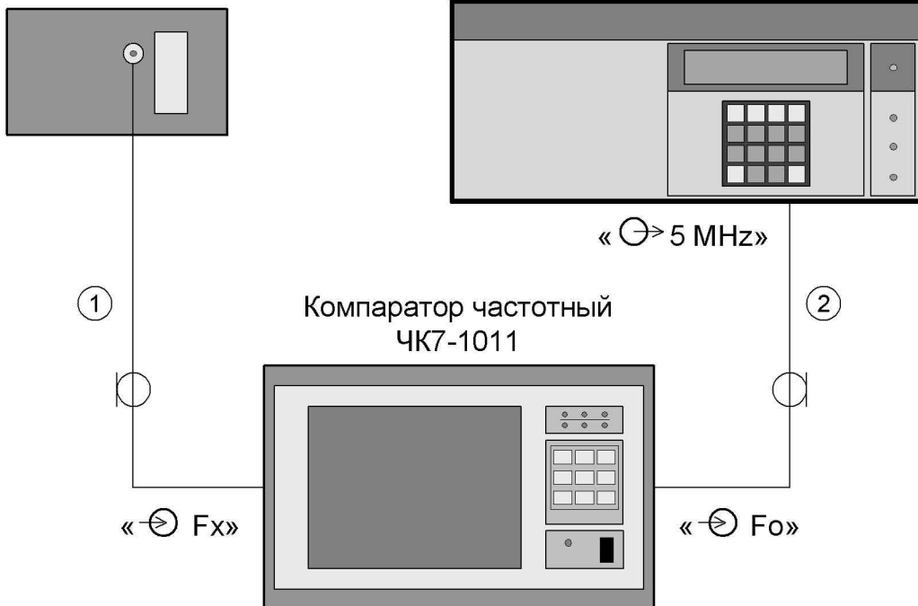
Рисунок 7.1 – Схема электрическая подключения приборов для определения относительной погрешности по частоте выходного сигнала, систематического относительного изменения частоты за 1 мес. и среднеквадратического относительного двухвыборочного отклонения частоты за 1 с, 10 с, 100 с и 1 сут.

Стандарт частоты и времени водородный Ч1-1007