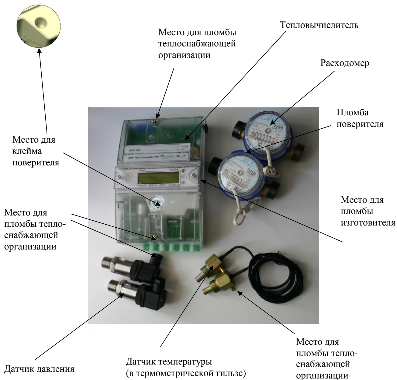
Рисунок 2 - Общий вид теплосчетчика «Терминал-Теплосчетчик/Распределитель МУР 1001.5 SmartOn ТТР ОД»