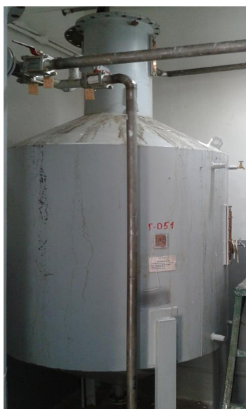
Рисунок 1 - Общий вид мерника металлического технического 1 класса ГЦ-250

Общий вид мерников представлен на рисунках 1 и 2.