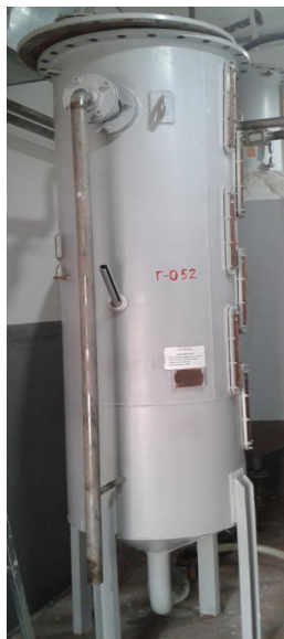
Рисунок 2 - Общий вид мерника металлического технического 1 класса ГЦ-75

Схема пломбировки от несанкционированного доступа, обозначение места нанесения знака поверки и знака утверждения типа представлены на рисунке 3.