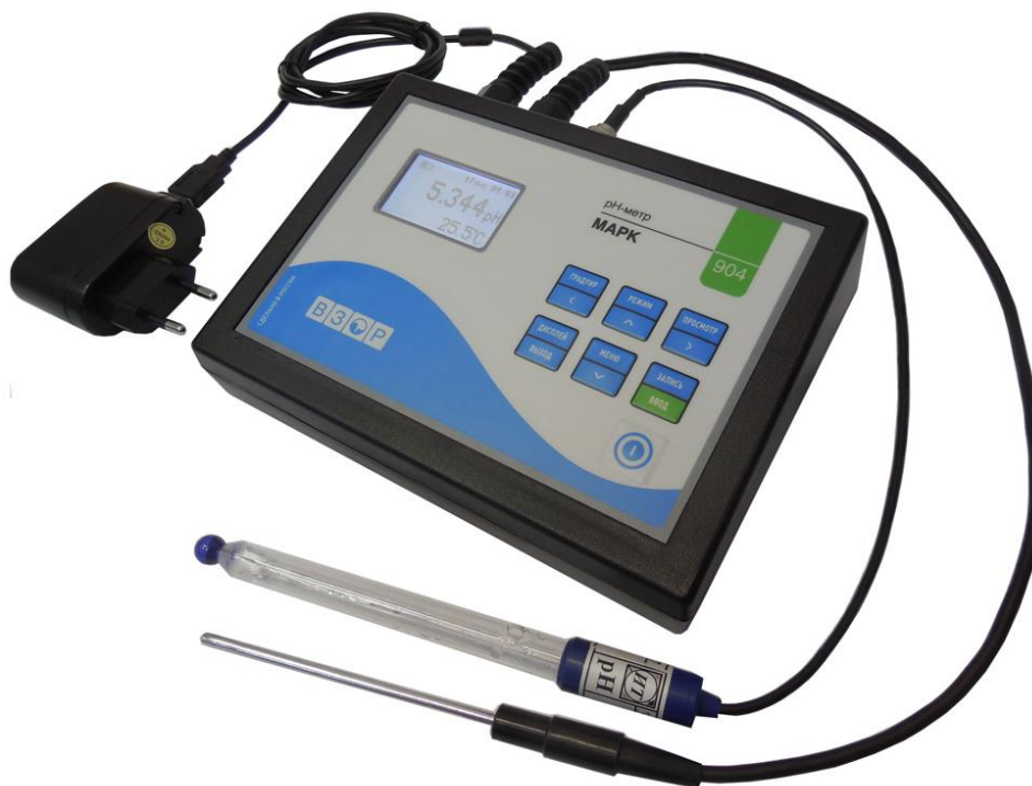
Рисунок 1 - Общий вид рН-метра