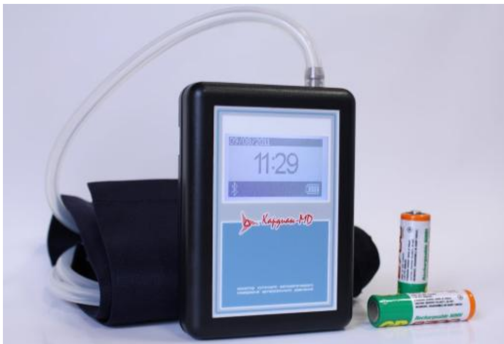
Рисунок 1 - Общий вид монитора суточного автоматического измерения артериального давления «КАРДИАН МД»