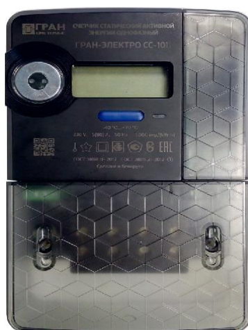
Рисунок 3 – Общий вид модификации счетчиков «Гран-Электро СС-101-XXXXB»