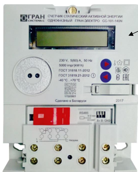
Рисунок 9 – Место нанесения знака поверки на счетчик модификации «Гран-Электро СС-101-XXXN»