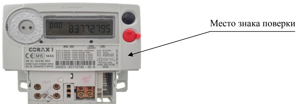
Рисунок 7 – Место нанесения знака проверки на счетчик модификации «Гран-Электро СС-101-XXXXS» после проверки (вид со снятой крышкой зажимов)