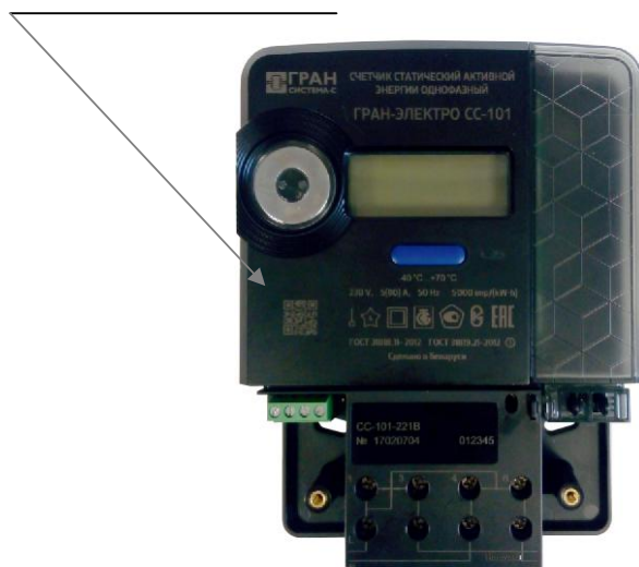
Рисунок 8 – Место нанесения знака поверки на счетчик модификации «Гран-Электро СС-101-XXXВ»