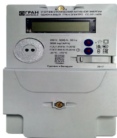
Рисунок 4 – Общий вид модификации счетчиков «Гран-Электро СС-101-XXXXN»