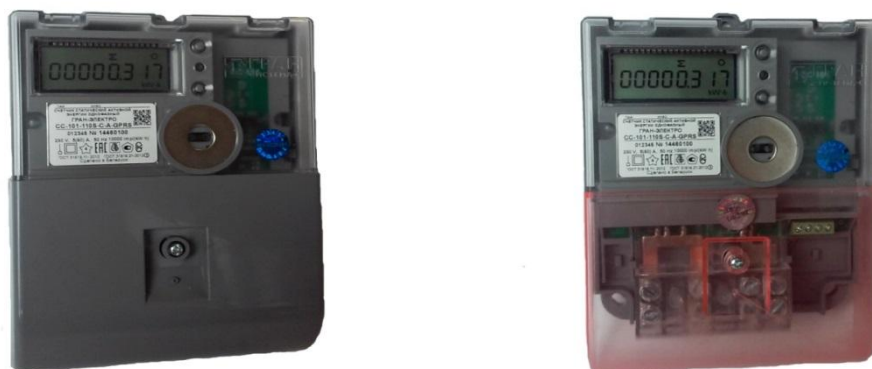
Рисунок 1 – Общий вид модификации счетчиков «Гран-Электро СС-101-XXXX» (с прозрачной крышкой и без)

Места нанесения знака поверки на счетчик представлены на рисунках 6 - 10.