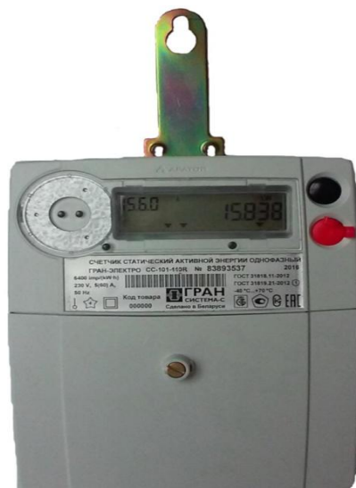
Рисунок 2 – Общий вид модификации счетчиков «Гран-Электро СС-101-XXXXR»