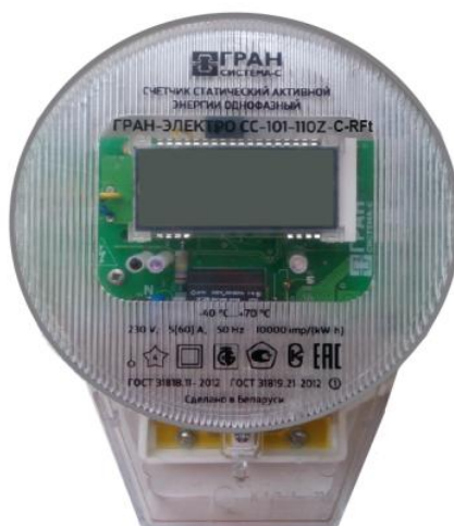
Рисунок 5 – Общий вид модификации счетчиков «Гран-Электро СС-101-XXXX»