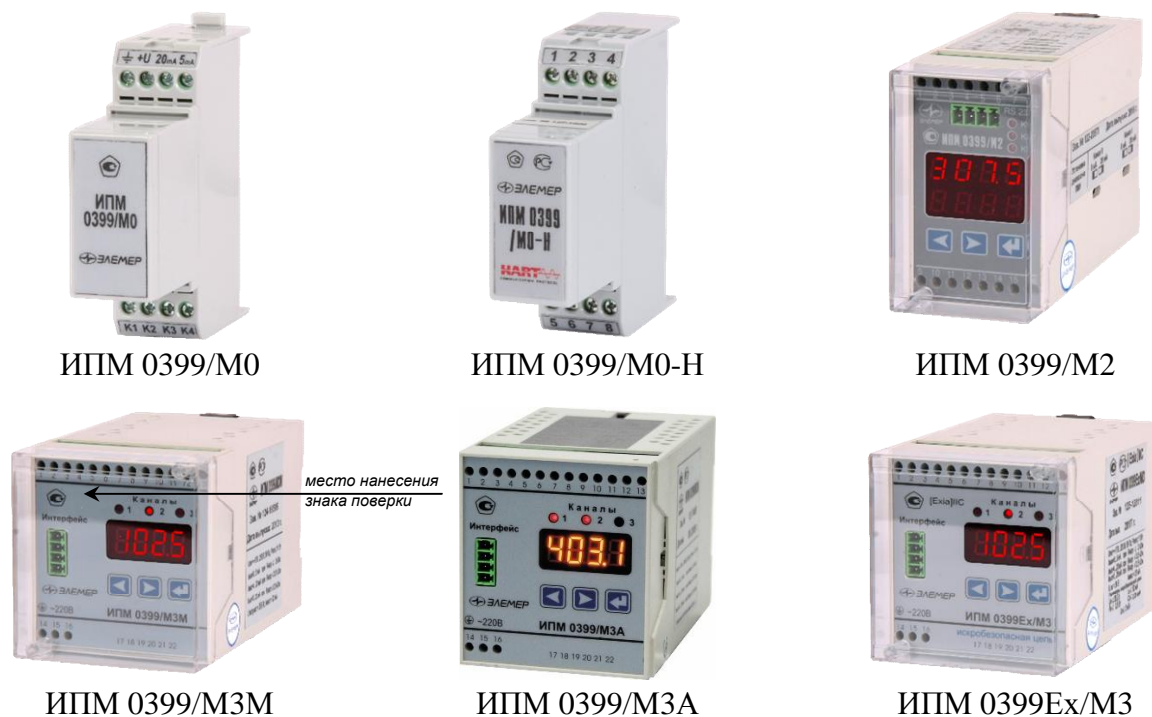
Рисунок 1 - Общий вид преобразователей измерительных модульных ИПМ 0399 и обозначение места нанесения знака поверки

Схема пломбировки от несанкционированного доступа представлена на рисунке 2.