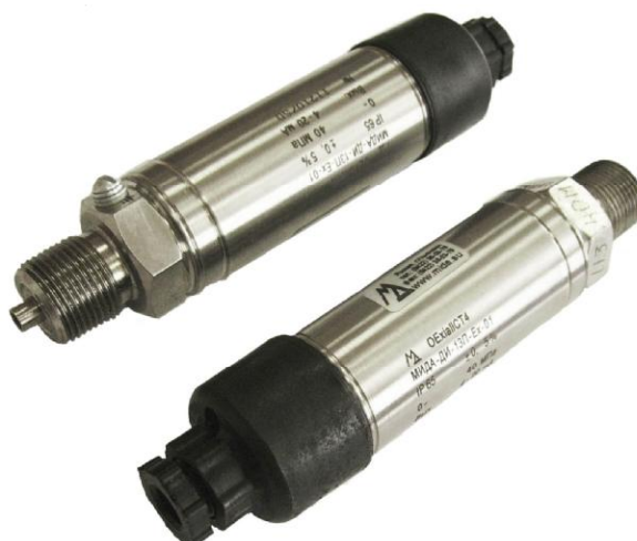
Рисунок 1 - Общий вид датчиков давления МИДА-13П

Пломбирование датчиков давления МИДА-13П не предусмотрено.