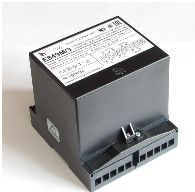
Рисунок 1 - Общий вид ИП