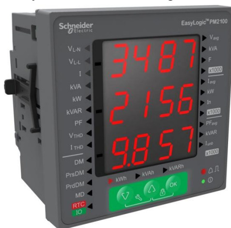
Рисунок 2 - Счетчики серии PM2100