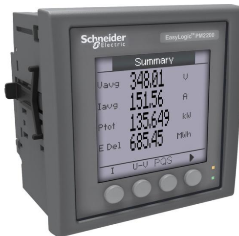
Рисунок 1 - Счетчики серии PM2200

Фотографии модификаций счетчиков и места опломбирования представлены на рисунках 1, 2 и 3.