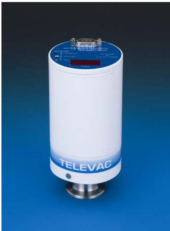
Рисунок 1 - Общий вид вакуумметров электронных со встроенным дисплеем MP7ER и MP7FR

Во избежание несанкционированного вскрытия корпус вакуумметров электронных со встроенным дисплеем MP7ER и MP7FR защищён разрушающейся при вскрытии наклейкой с нанесённой надписью «msht.ru». В случае попытки вскрытия корпуса целостность наклейки нарушается. Место нанесения наклейки показано на рисунке 2.