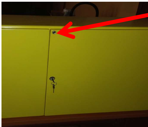
Рисунок 2а - Схема пломбирования ЭПР