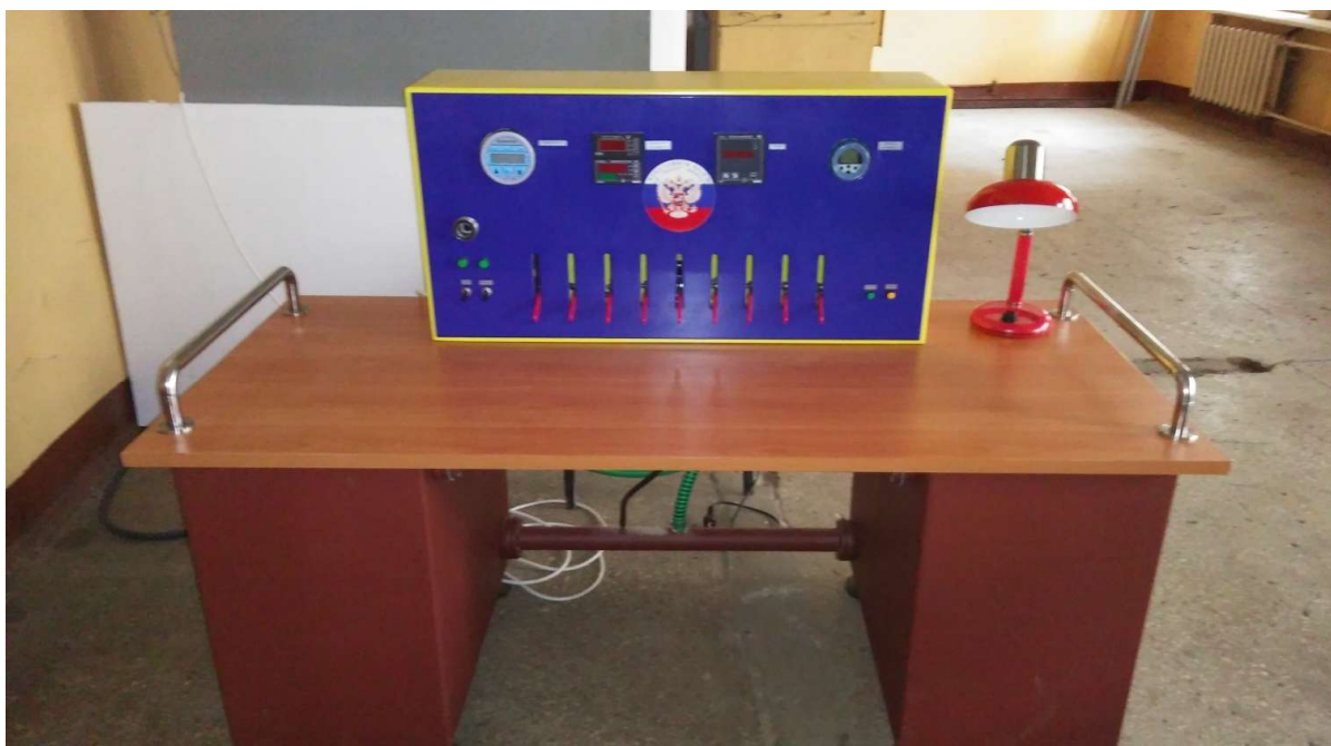
Рисунок 1 - Модификация «УПСГ-БП -16-РС»

Общий вид установок представлен на рисунке 1.