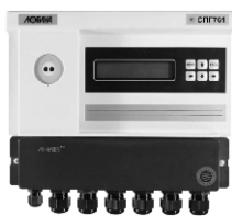
Рисунок 1 - Корректор СПГ761 (СПГ762)

Общий вид составных частей ИК приведен на рисунках 1 - 6.